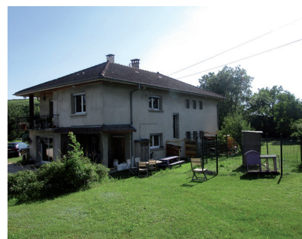
L'Accueil de Jour de Saint-Didier-de-la-Tour.

- La Clef des Petits 8 (0-4 ans) - 1,6 ETP Territoires VDD et PDA Quelques mesures sur les communes limitrophes sur le territoire Haut Rhône Dauphinois (HRD)