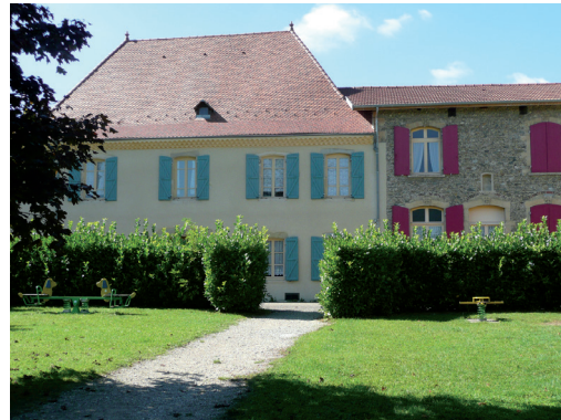
La MECS La Clef des Champs.