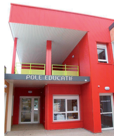
La Licorne et l'Épopée

• Rénovation Le programme de rénovation de l'ensemble des structures, démarré en 2009, devrait se terminer en 2017 avec la reconstruction des Hespérides aux Neyrolles.